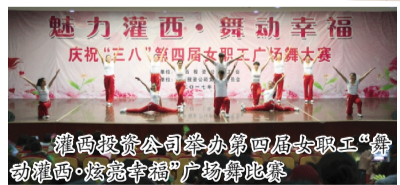
灌西投资公司举办第四届女职工“舞动灌西·绽放幸福”广场舞大赛