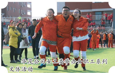
华茂公司女工委举办女职工系列文体活动