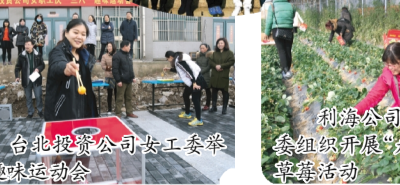
台北投资公司女工委举办趣味运动会