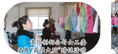
黄化制钙公司女工委开展“最强女脑”精英活动