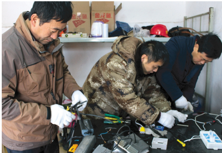
日前，徐圩悦升市政分公司及时利用刮风、下雨等不利于户外作业的时间，集中人力对路灯日常维护工作中拆解下来的灯具、电源磨块等废旧物品进行调试修复再利用，以实际行动营造出“节支增效”新氛围。2016年，该公司调试修复路灯电源模块就有100余套，为公司节约一大笔成本费用。（晁华 胡可志）

坚持品牌经营机制拓市场。年内重点实施好食用原料盐基地项目建设，按照一流的质量标准，做好滩地的设计和改造，提高滩地制卤能力。认真做好海水卤和矿卤结合产盐工艺研究，确保年产1万吨具有海盐标准的盐产品。出台《原盐销售奖惩办法》，鼓励广大员工跑销售、拉业务、增收入，全年力争销售原盐55万吨，实现销售收入1.3亿元以上。（季兴胜）